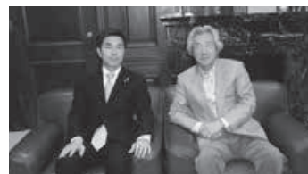
小泉元総理と。甘利大臣とともに経済再生を引っ張る。菅官房長官に電気料金引き上げ幅圧縮を申し入れ。