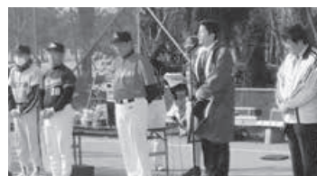
(左)復興支援リトルリーグにて。 (右)指扇ソフト開会式。